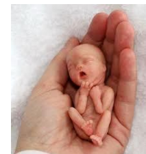
Embrione di tre mesi.!

Con l'aborto, sei tu che glielo permetti. Non glielo dare. Tienilo tu. Difendi tu, il tuo bambino. Onora tu il tuo bambino. Abbi pietà tu, del tuo bambino. Abbi misericordia, del tuo bambino !!! In nome di Dio!